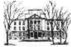
Istituto tecnico commerciale e turistico statale "Vittorio Emanuele II" BG

Associazione Ricerche Interdisciplinari Psicologia del Turismo