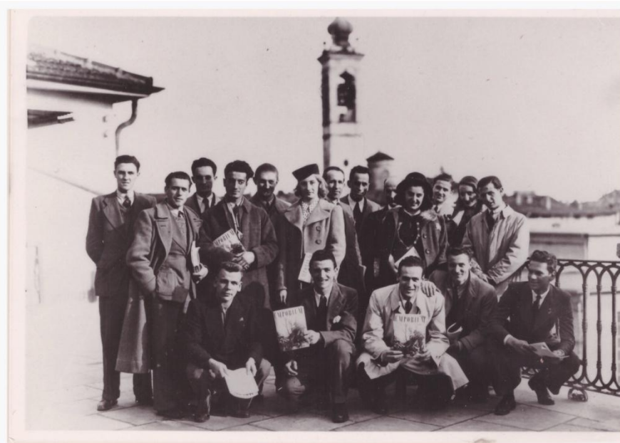
6.a Visita aziendale all'Istituto Italiano d'Arti Grafiche via S. Lazzaro Bergamo nella primavera dell' a. s. 1940; gli studenti hanno ricevuto in dono un numero della prestigiosa rivista d'arte e grafica "Emporium" pubblicata dall'azienda dal 1895 al 1964.