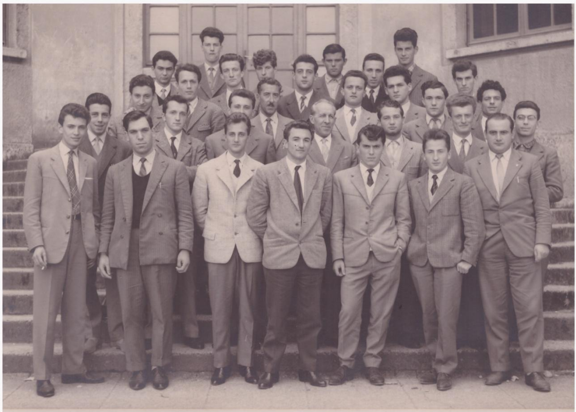
9.a Classe 5 A a.s. 1956-57