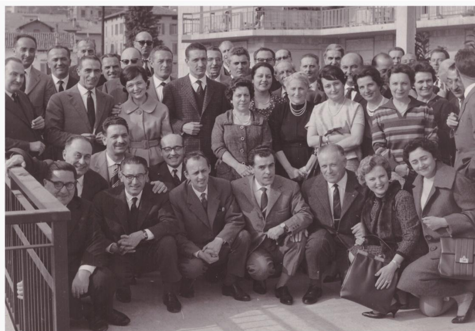
13. 1961 Ragionieri diplomati nel 1936 nel venticinquennio. Sul retro scritto a mano "Foto 1961 diplomati 1936"; Foto Welles Piazza Pontida, 15 - 4 aprile 1961