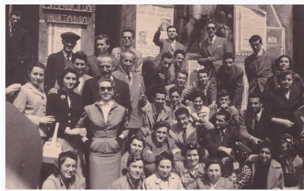
7.a Visita d'istruzione alla Borsa e alla Fiera Campionaria di Milano 1953