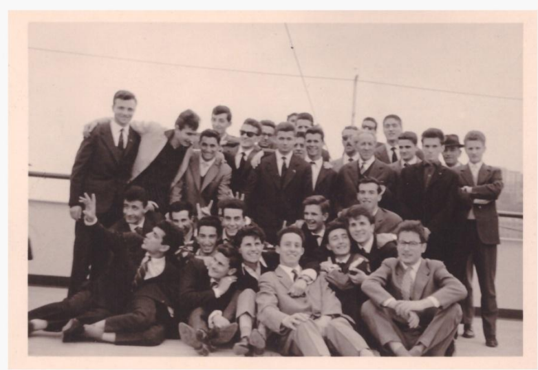
12. Classe 5A Gita a Genova 1961 19 maggio Retro Scritto a mano "Gita a Genova 5A 19.05.1951 t/n Leonardo da Vinci"