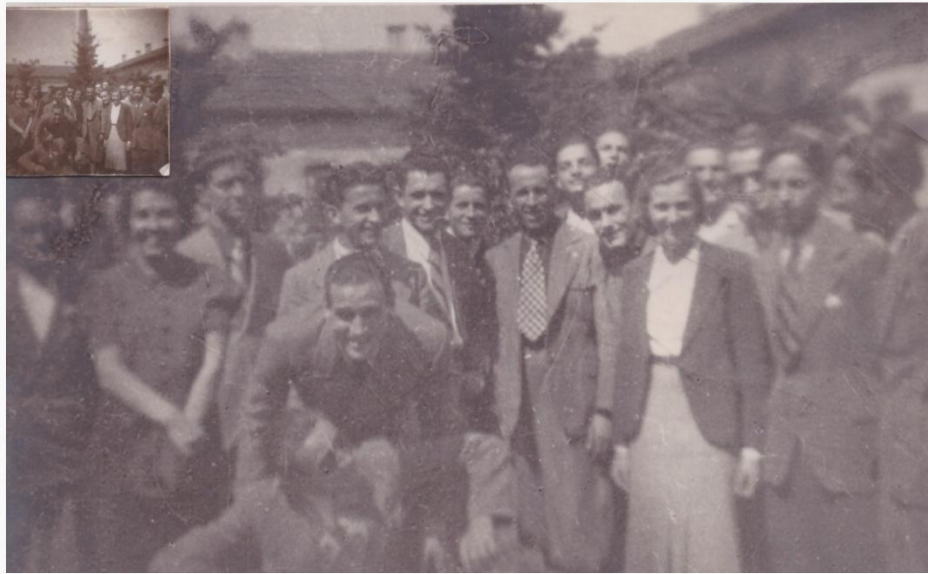
5. Visita aziendale alla Filanda (Necchi o Nembrini?) di Zanica 14 maggio 1938 classe 3 sup. A