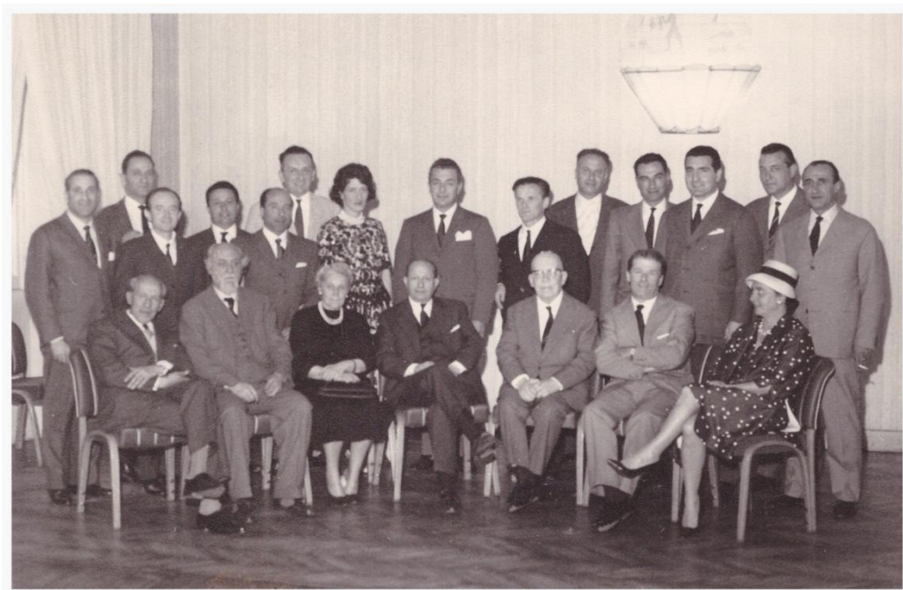
15. 1961 Incontro conviviale diplomati nel venticinquennio dal diploma nel 1936 Sul retro scritto "1961 Incontro conviviale nel venticinquennio dal diploma nel 1936"