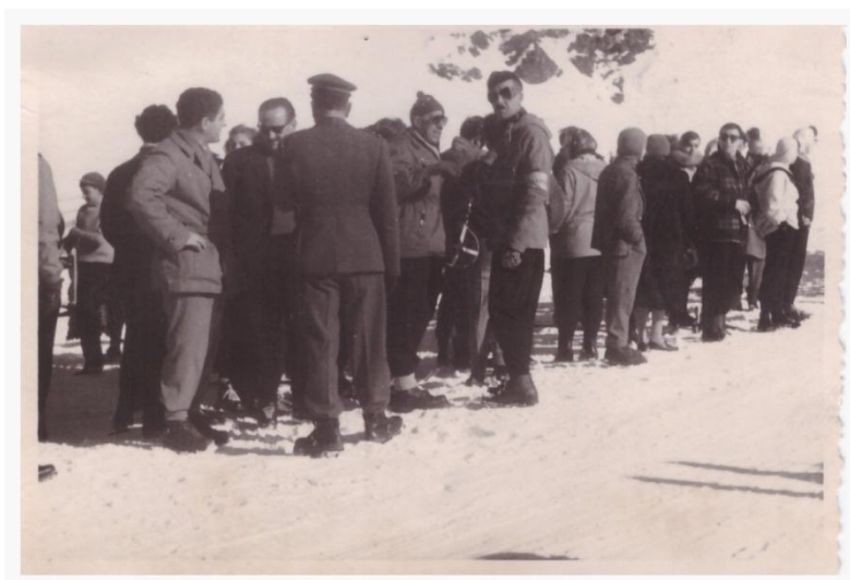
18. Gita sulla neve [Dove e quando?]