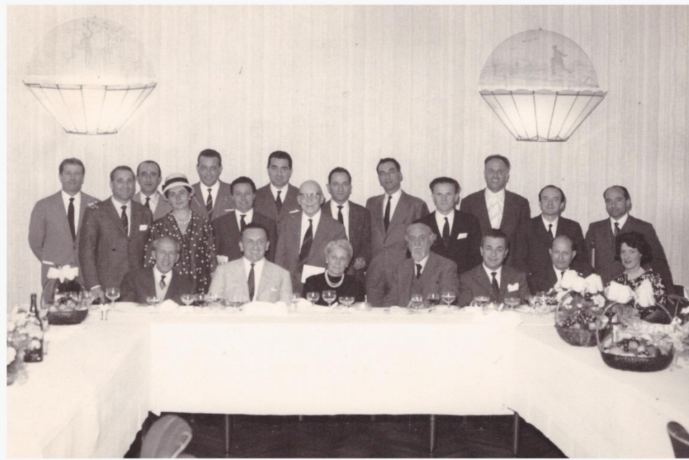
14. 1961 Diplomati nel 1936 incontro conviviale nel venticinquennio. Retro scritto a mano "Diplomati nel 1936 incontro conviviale nel venticinquennio (1961)"; Foto Express via S. Francesco d'Assisi Bergamo