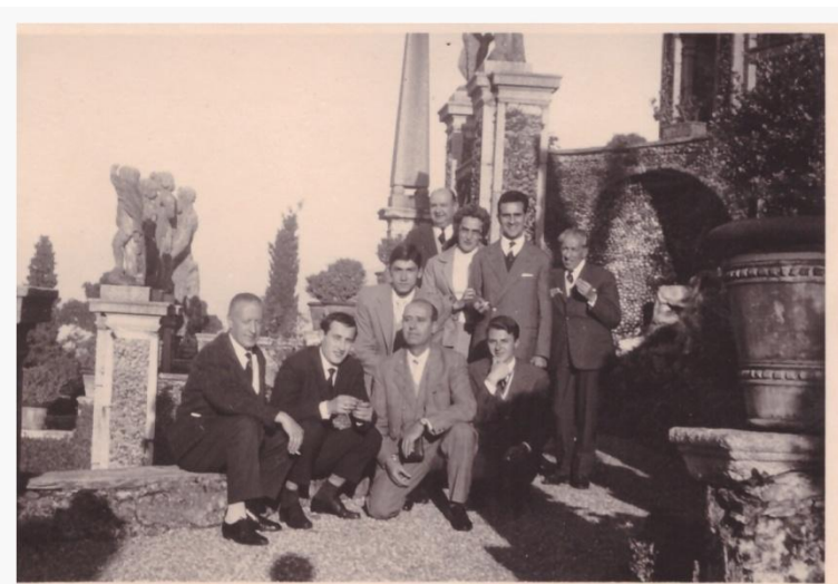
17. Foto Gita scolastica [Dove e quando?]