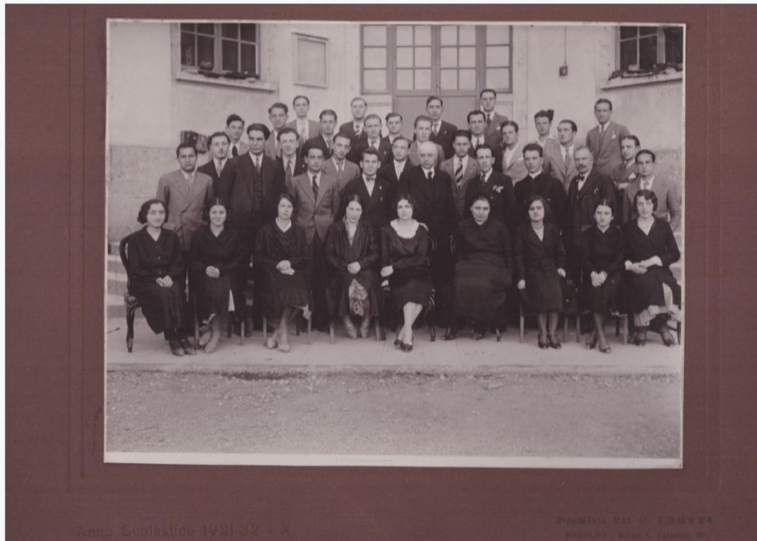
2. Licenziandi ragionieri Istituto Tecnico con i professori a.s. 1931-1932.