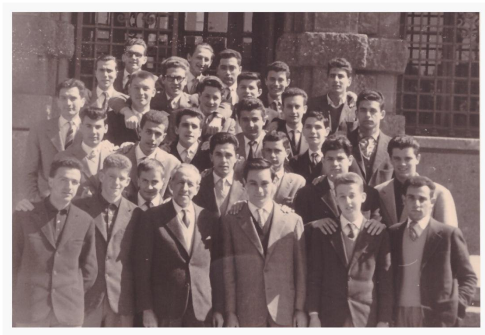
10. Classe 5A a.s. 1959.

Sul retro: Bergamo 11 Aprile 1959 classe 5 A